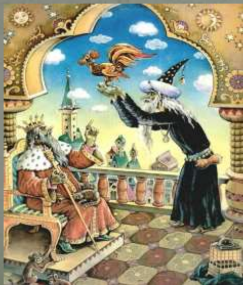
«Сказка о золотом петушке»

«Сказка о царе Салтане, о сыне его славном и могучем богатыре князе Гвидоне Салтановиче и о прекрасной царевне Лебеди»