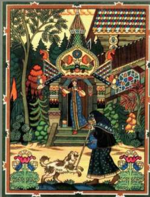
«Сказка о мертвой царевне и семи богатырях»