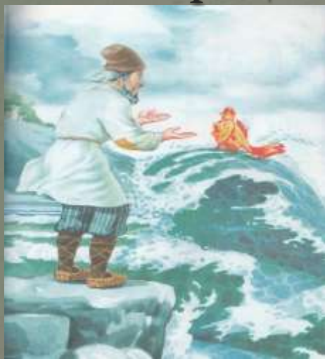
«Сказка о рыбаке и рыбке»